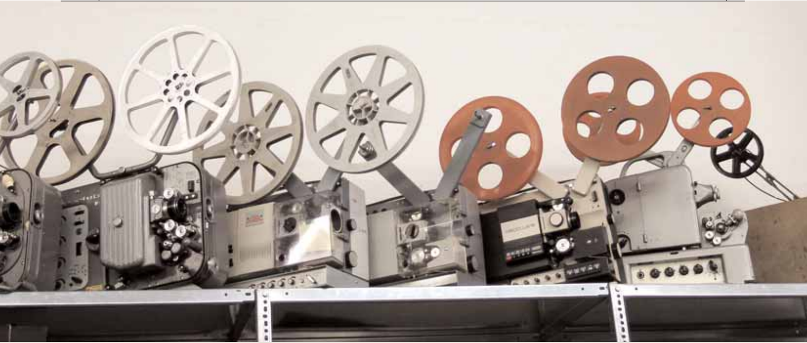
Meos in Reih und Glied.

lischsprachige Publikationen. Mit dem Erwerb eines reichen Konvolutes an Patent- und Gebrauchsmustern (Kategorie 57a des Deutschen Patentamtes: fotografische und kinematographische Geräte 1897–1968) und der Erweiterung der wohl deutschlandweit größten Dokumentensammlung zur filmtechnischen Industrie fördert das Museum Forschungen zu diesem Fachgebiet. Während die Patentunterlagen derzeit in einer Datenbank erschlossen werden, erfolgt die Katalogisierung der anderen Druckschriften alphabetisch nach Firmennamen – von AEG und AFIFA bis Zechedorff und Zeiss Ikon. Die intensive Pflege des Schriftgutes zu mittlerweile 450 Unternehmen ergibt sich einerseits aus seiner Bedeutung für die Identifizierung von Sammlungsstücken und andererseits aus seinem hohen materiellen Wert. Frühe Angebotskataloge von Pathé, Gaumont, Grass & Woff, dem Hamburger Kinohaus Döring oder den Dresdner Firmen Ernemann und Unger & Hoffmann sind heute extrem rar und oft seltener als die darin annoncierten Geräte. Nicht unerwähnt bleiben sollen einige in der Erschließung befindliche Nachlässe von wichtigen deutschen Filmtechnikern, etwa von KurtENZ oder Wolfgang Grau.