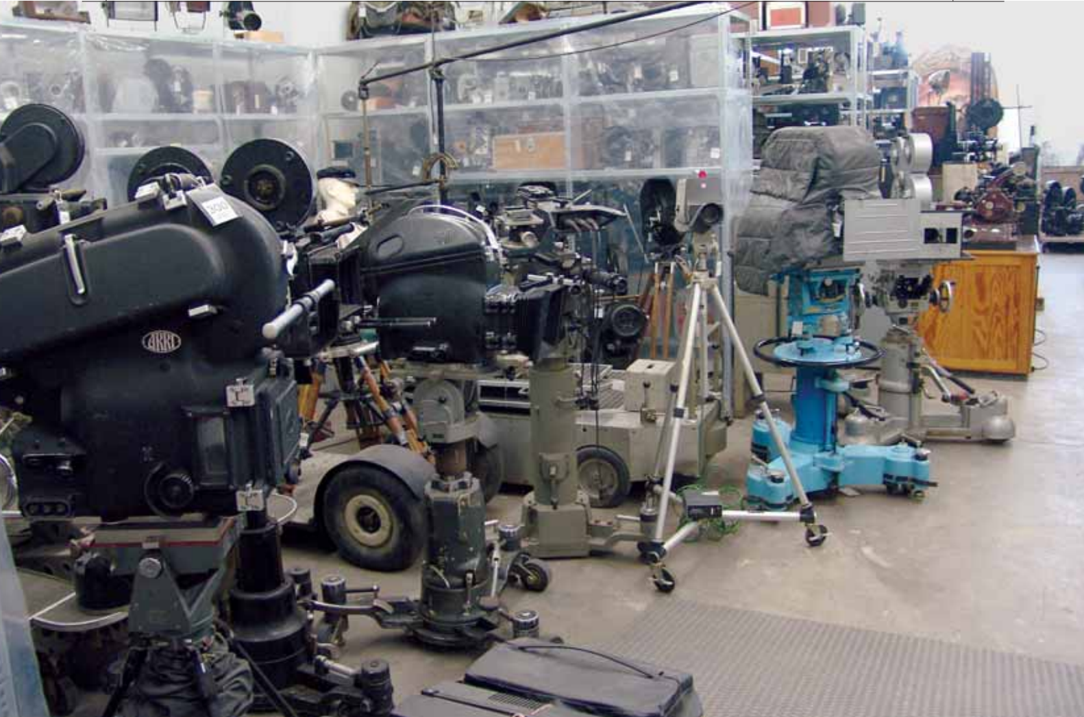
Geblimpte Kameraschätze im Schaudepot.

räte, Schneide- bzw. Sichtungstische, Umroller, Verstärker sowie elektrische Schalt- und Zubehörteile aus Filmtheatern. Selbstbaugeräte wie durch Filmemacher und Techniker verbesserte Modelle genießen als Unikate besondere Wertschätzung. Die Bestandserweiterung erfolgt also einerseits örtlich konkret und zum anderen inhaltlich wie technisch weit gefaßt. Auch wird im Gegensatz zu anderen Filmmuseen der Technologiesprung zur Video- und Digitaltechnik an ausgewählten Beispielen berücksichtigt.