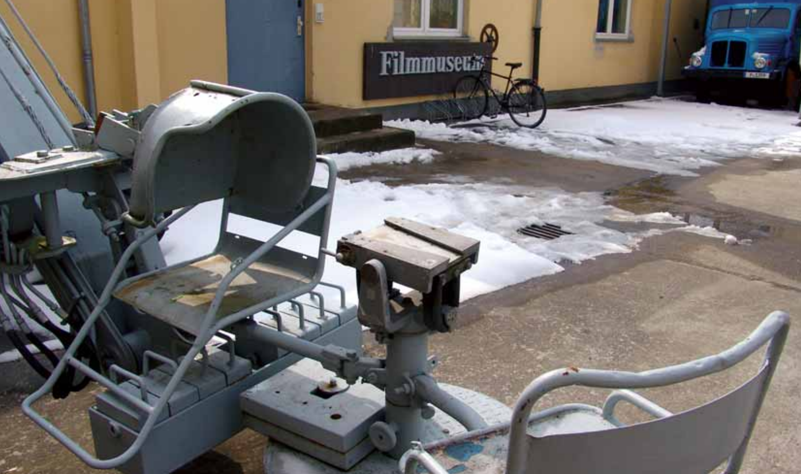
Kran und Kinowagen vor dem unscheinbaren Eingang zum Schaudapot des Filmmuseums Potsdam.

Wer aber die Nähe zu den kinematographischen Objekten sucht und dazu aus sachkundiger Hand Details erfahren will, sollte das im Gebäude der Sammlungen eingerichtete Schaudapot aufsuchen und eine Führung buchen. Auf ca. 300 qm werden nicht nur die wichtigsten Techniken und Bearbeitungsschritte des Films an aussagekräftigen Beispielen nachvollzogen, sondern der Besucher gewinnt auch Einblicke in die schwierige und entscheidungsintensive Tätigkeit der Bestandspflege. Inwieweit ist es z. B. sinnvoll, historische Geräte nach der Restaurierung zu verhüllen, um sie dauerhaft vor Verfall zu schützen? Wann kann vertreten werden, einen Agfa-Movector 16 kurz in Betrieb zu setzen, um einer Interessentengruppe das authentische Projektorgeräusch und die (mäßige) Lichtleistung zu demonstrieren? Auf welchen Auswahlkriterien beruht die Übernahme von industriell hergestelltem, technischem Sammlungsgut? Letztlich dienen Führungen auch immer dazu, für die kulturell wichtigen und nur durch öffentliche Zuschüsse zu erfüllenden Funktionen eines Museums zu werben.